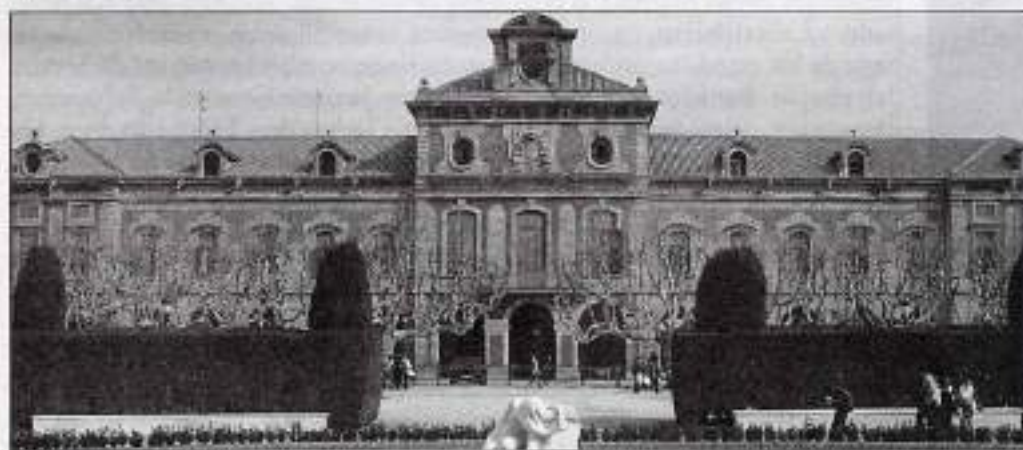
El Parlament de Catalunya.