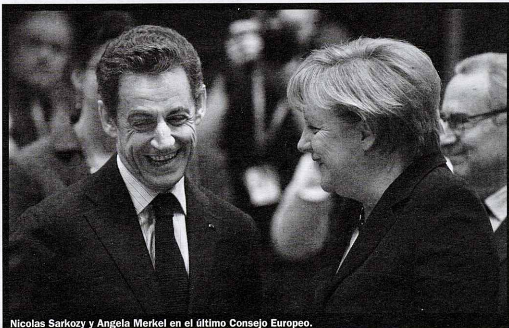
Nicolas Sarkozy y Angela Merkel en el último Consejo Europeo.

Profesor de Esade (Universitat Ramon Llull)